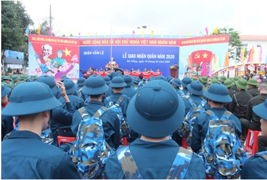
Quang cảnh lễ giao quân

Đã thành truyền thống, hằng năm sau khi vui xuân, đón tết cổ truyền của dân tộc, hằng trăm bạn trẻ quận Cẩm Lệ phấn khởi, nô nức lên đường làm nhiệm vụ cao cả thiêng liêng của người chiến sĩ, đi bất cứ nơi đâu Tổ quốc cần. Và cũng như thường lệ, bên cạnh niềm vui đón chào năm mới, cán bộ và nhân dân quận Cẩm Lệ đã chuẩn bị mọi điều kiện tốt nhất như tổ chức gặp mặt, tặng quà động viên con em mình lên đường làm tròn trách nhiệm của người thanh niên đối với Tổ quốc, dân tộc. Thật phấn khởi, tự hào, năm 2020 này, toàn quận Cẩm Lệ có 165 thanh niên nhập ngũ, trong đó có 135 thanh niên nhập ngũ vào các đơn vị quân đội nhân dân và 30 thanh niên nhập ngũ vào các đơn vị công an nhân dân.