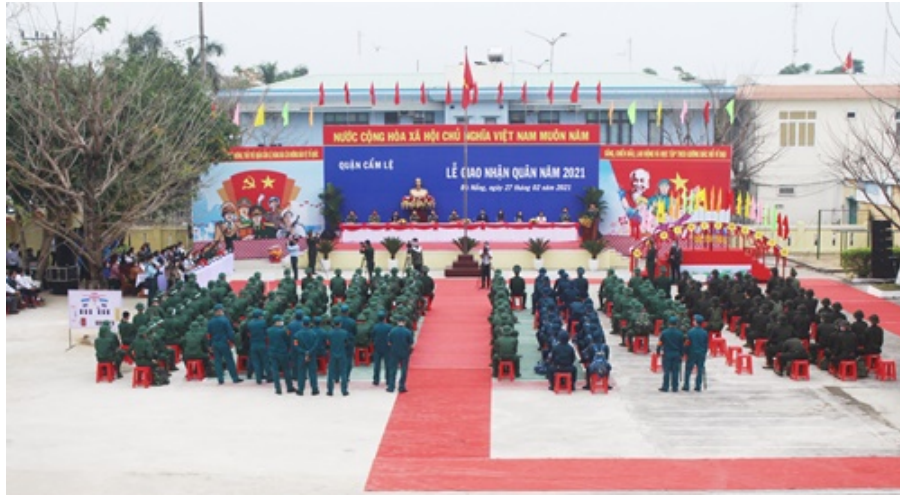
Toàn cảnh Lễ giao nhận quân

Năm 2021, toàn quận có 163 thanh niên nhập ngũ vào 06 đơn vị: Lữ đoàn Thông tin 132; Sư đoàn Phòng không 375 Quân chủng Phòng không, không quân; Lữ đoàn Thông tin 575 Quân khu V; Biên phòng thành phố; Trung đoàn Bộ binh 971/Bộ Chỉ huy quân sự thành phố Đà Nẵng và Công an thành phố Đà Nẵng.