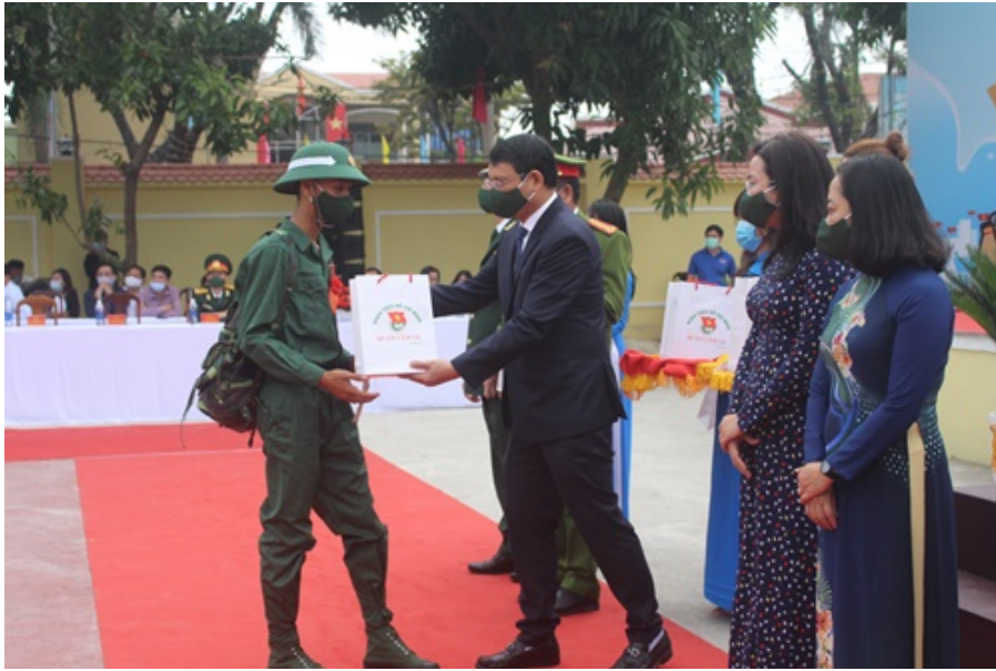
Đồng chí Hồ Kỳ Minh - Phó Chủ tịch UBND thành phố tặng quà cho thanh niên nhập ngũ