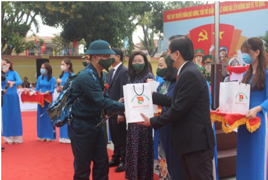
Lãnh đạo quận Cẩm Lệ tặng quà cho thanh niên nhập ngũ

Để đảm bảo công tác phòng chống dịch Covid-19, an ninh tại Lễ giao nhận quân được thắt chặt. Việc tổ chức Lễ được thực hiện trang trọng, nhanh gọn, an toàn. Thanh niên phấn khởi, hăng hái lên đường nhập ngũ./.